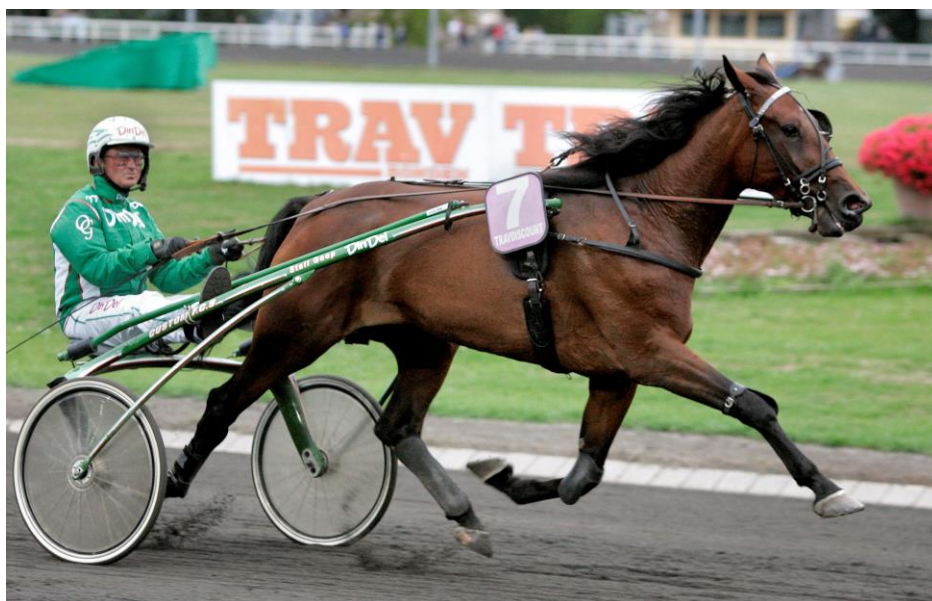
Keep on Party og Olle Goop -

Spik Party, hvis rekord er omtalt tidligere, kan være unik som den danske travhest med dansk/amerikansk moderlinje, der har mest fransk blod? Næsten 30 % i kraft af far Defi d'Aunou og farfar Cocktail Jet.